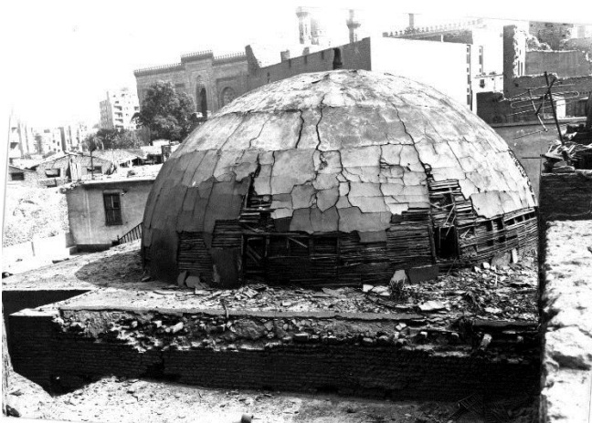
La cupola, prima del restauro del 1988

La Formazione: tutti i lavori sono stati realizzati attraverso il cantiere-scuola , permettendo di apprendere e di vivere gli interventi a tutti i livelli professionali.