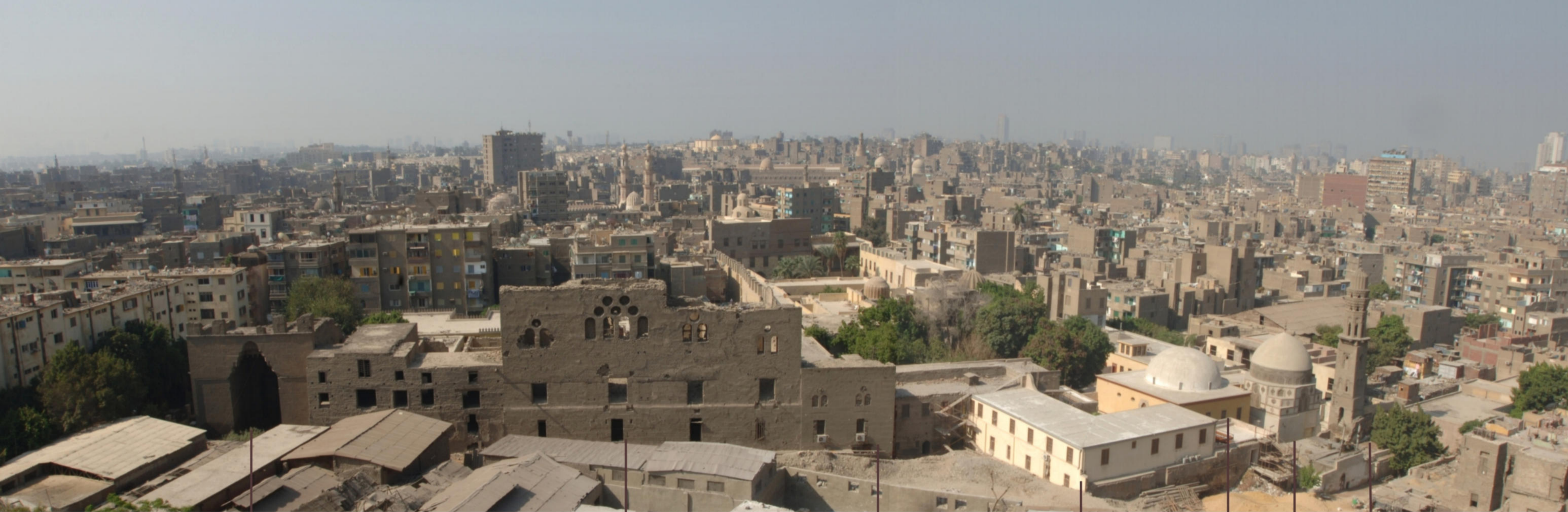
PORTALE DI YASHBAK