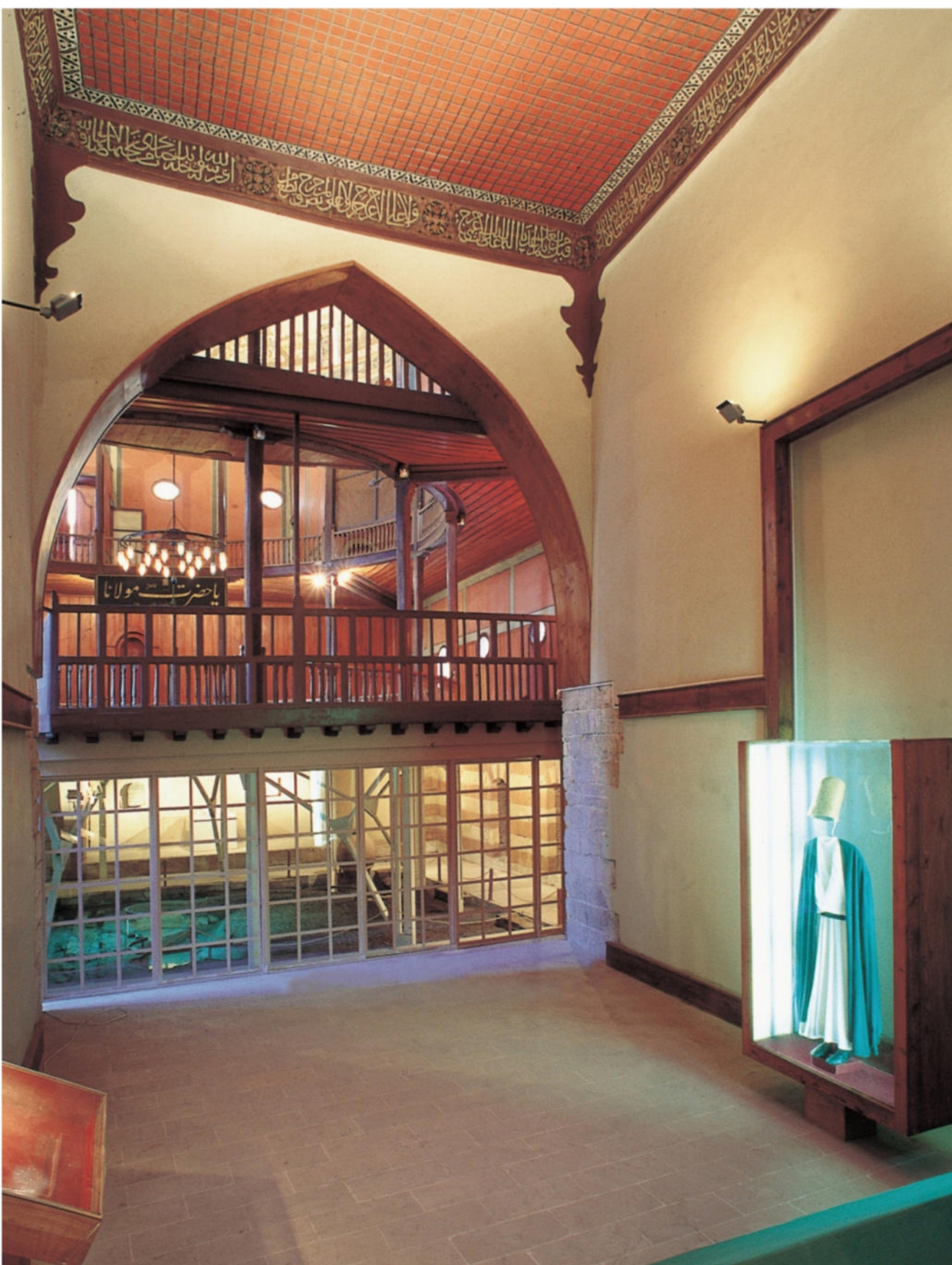
Iwan della madrasa, sullo sfondo la sama'khana

Il design, quale elaborazione tecnica e formale degli interventi, ha assicurato la protezione dell'identità originale e storica dei monumenti (si veda la mostra "Restauri e Restauratori". In: www.cfpr.eu ).